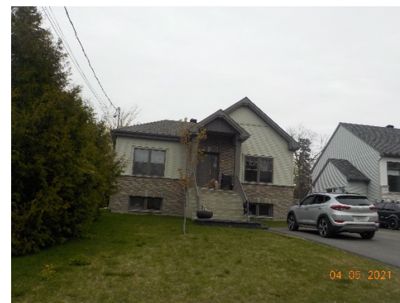
17, 46 e Avenue (voisin de droite)