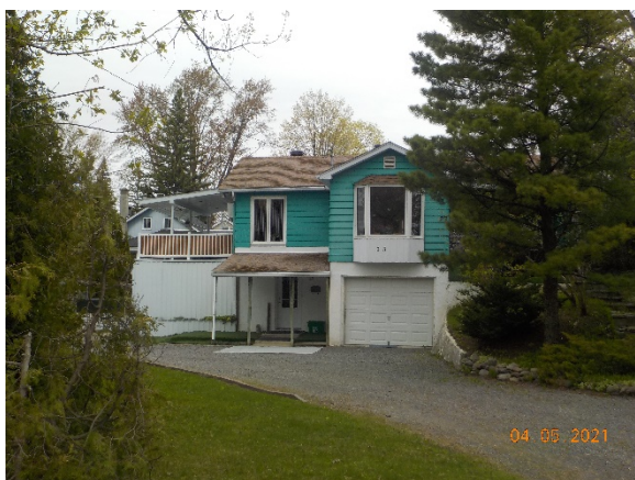
23, 46 e Avenue (voisin de gauche)